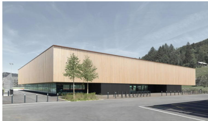
Sporthalle von Osten