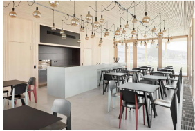
Flexzone (Bistro) von Innen