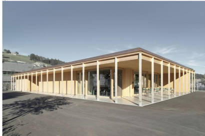
Flexzone (Kiosk, Bistro) von Südwesten